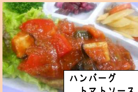
ハンバーグ トマトソース