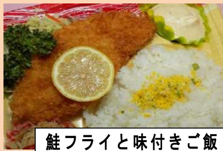
鮭フライと味付きご飯