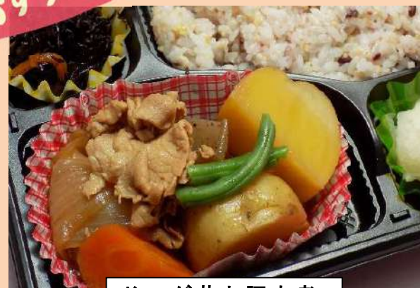
じゃが芋と豚肉煮