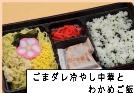
ごまだレ冷やし中華と わかめご飯