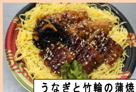
うなぎと竹輪の蒲焼