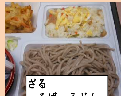
ざる そば・うどん