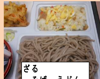
ざる そば・うどん