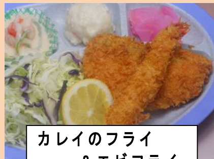
カレイのフライ & エビフライ