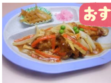
とり唐揚げの 野菜甘酢あん