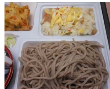
ざる そば・うどん