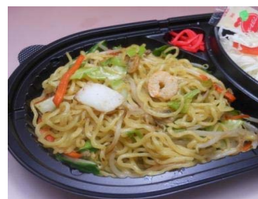
シーフード 塩焼きそば