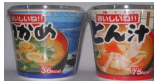
わかめ・トン汁・ほうれん草 各¥120(税込)