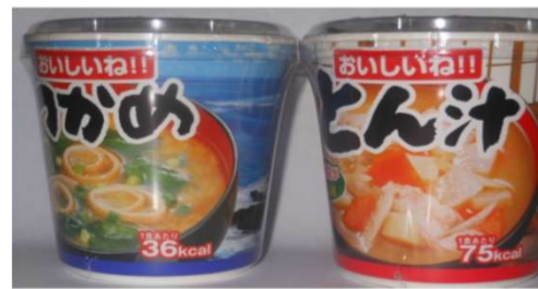
わかめ・トン汁・ほうれん草 各¥120(税込)