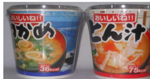
わかめ・トン汁・ほうれん草 各¥120(税込)