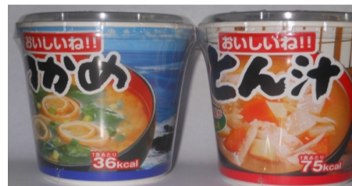
わかめ・トン汁・ほうれん草 各¥120(税込)

カ ッ プ み そ 汁 販 売 始 め ま し た ※前日ご予約での販売となります。