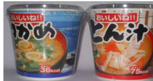
わかめ・トン汁・ほうれん草 各¥120(税込)