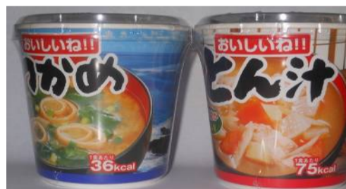
わかめ・トン汁・ほうれん草 各¥120(税込)